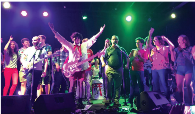
La banda de punk rock cubano "Porno Para Ricardo" en el Mini-Festival por el 15° aniversario de CADAL