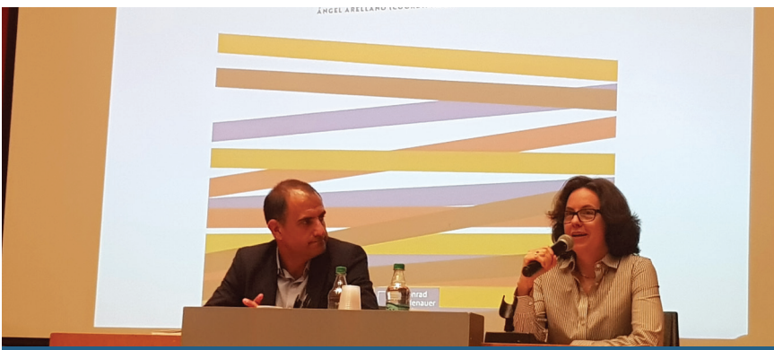
Presentación de libro con testimonios de la diáspora venezolana