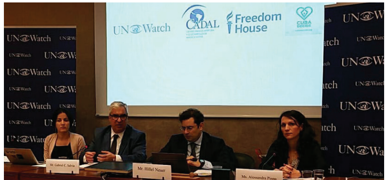
Conferencia en el Palais des Nations de la ONU en Ginebra junto a UN Watch, Freedom House y Cuba Decide