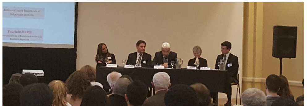
Conferencia en el Día Internacional en Recuerdo de las Víctimas del Totalitarismo