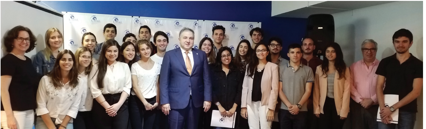
Participantes del Programa Good Bye Lenin junto al Embajador de Georgia y autoridades de CADAL